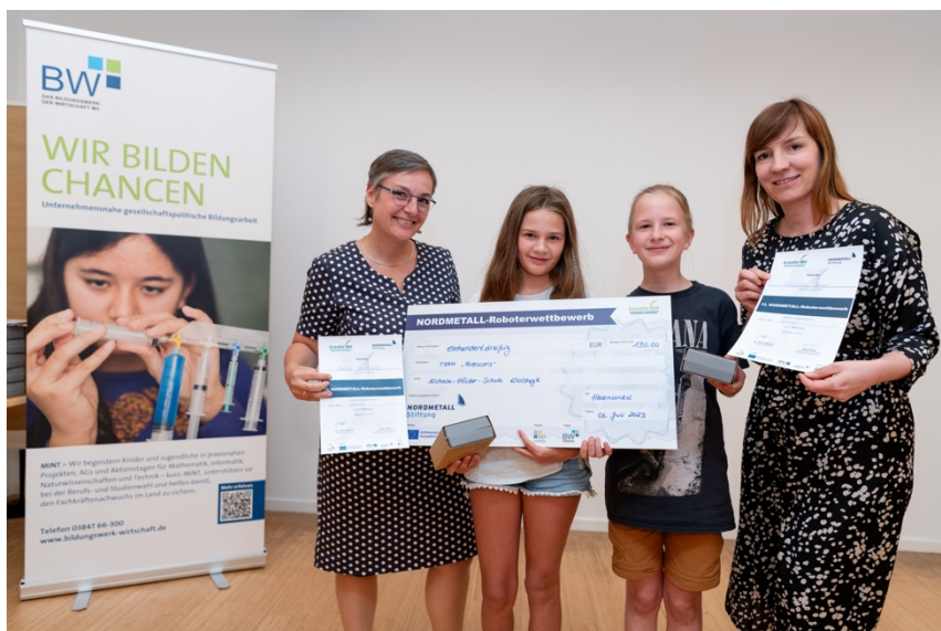
Bild: Siegerehrung Hasenwinkel

Lobend zu erwähnen ist, dass Sie die jüngsten Teilnehmer im Feld waren und unter anderem gegen frischgebackene Abiturienten angetreten sind.